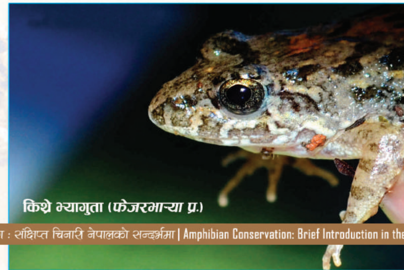
किथे भ्यागुता (फेजरभान्या प्र.)

Although Nepal does not have distinct law and guidelines for the conservation of amphibians however, the country being a member of various international conventions like Convention of International Trade in Endangered Species of Wild Fauna and Flora (CITES), and the Convention on Biological Diversity (CBD) which compels Nepal to conserve amphibians. Hoplobatrachus tigerinus (Indian bullfrog) is placed under CITES II category while Nanorana rostandi (Rostand's paa frog) and Sphaerotheca swani (Swan's burrowing frog) are reported in the Red Data book of Nepal. Establishment of Protected Areas like National Park, Wildlife Reserve, and Conservation Areas that restricts hunting, collection, harassing or damage to wildlife and their habitats. Other related legislative measures include;