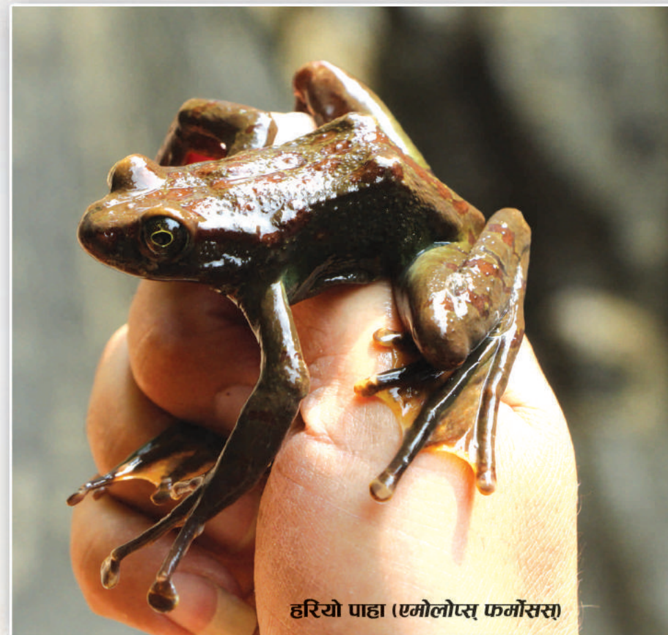
हरियो पाहा (एमोलोप्स फर्मोसस)