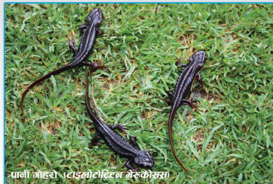
पानी गोहरो (टाइलोटेष्टिन मेरुकोसस)