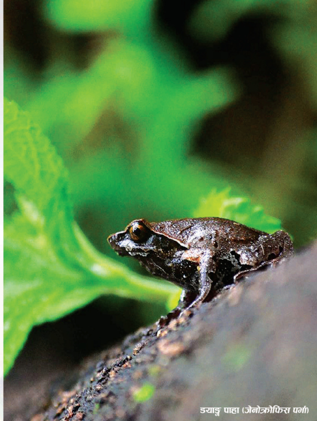
डयाङ्ग पाहा (जेनोक्रोफिस पर्मा)