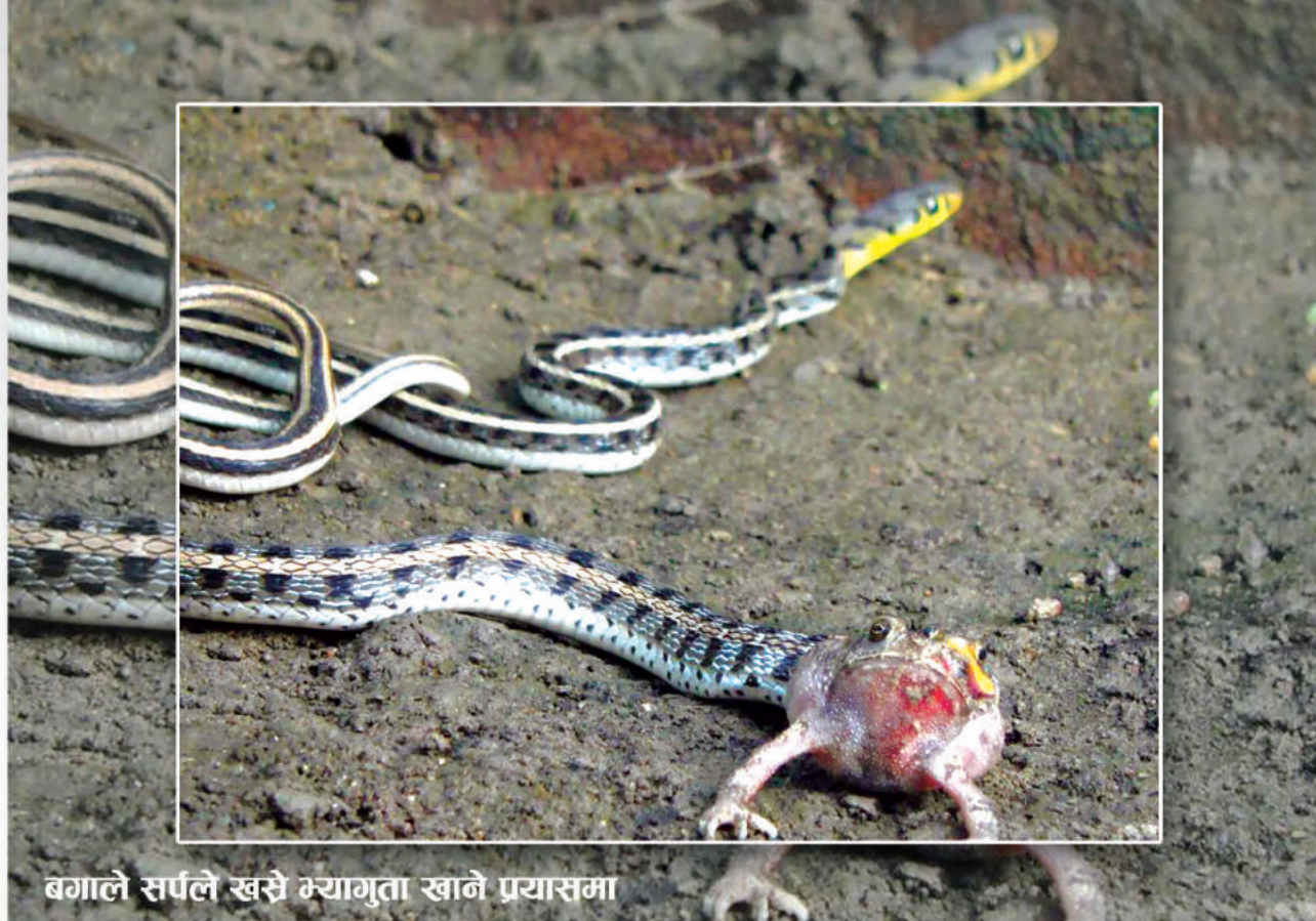
बगाले सर्पले खसे भ्यागुता खाने प्रयासमा

Frog is an important food source to many predators like fish, snakes, birds (hawks, eagles) and even some mammals (fox, wild dogs etc.). Thus, its disappearance will disturb the food web and cause negative impact on the ecosystem.