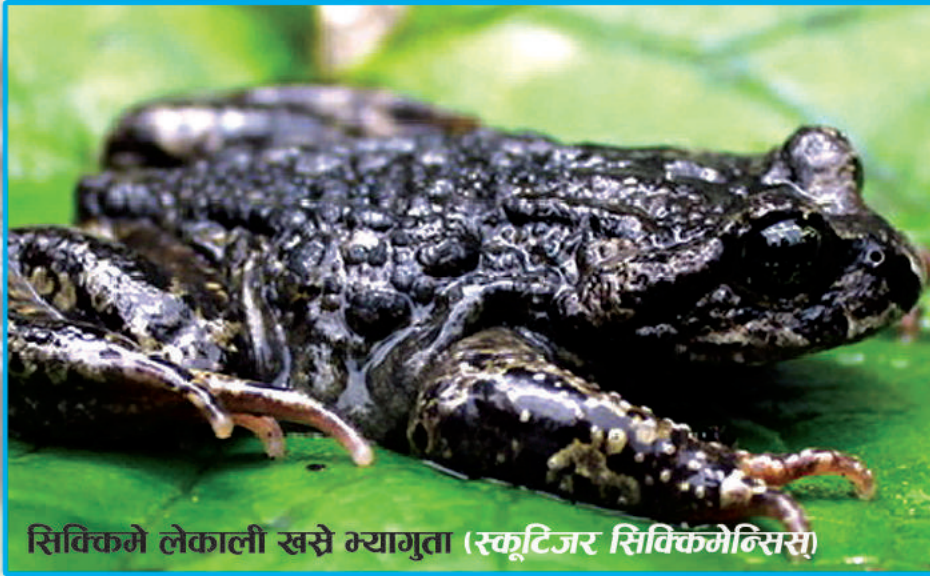
सिक्किमे लेकाली खसे भ्यागुता (स्कूटिजर सिक्किमेन्सिस)