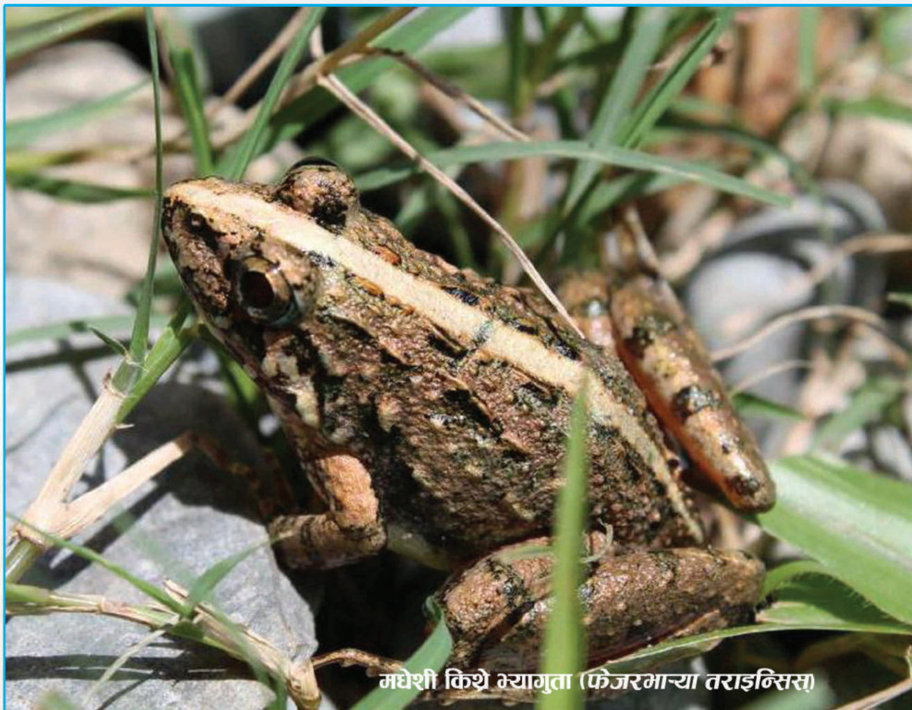
मधेशी किथे भ्यागुता (फेजरमाच्या तराइनिसा)

Many harmful insects cause severe damages to the rice plants like swarming caterpillars ( Spodetpera mauritia ), rice hispas ( Hispa armigera ), paddy grasshoppers ( Hieroglyphus banian , H. orziobra , H. nigroreplates ) and rice worms ( Nymphula depuntatis ). Frogs eat them and help biological control of the pests. Thus, frogs' croaking in the farm land is always beneficial.