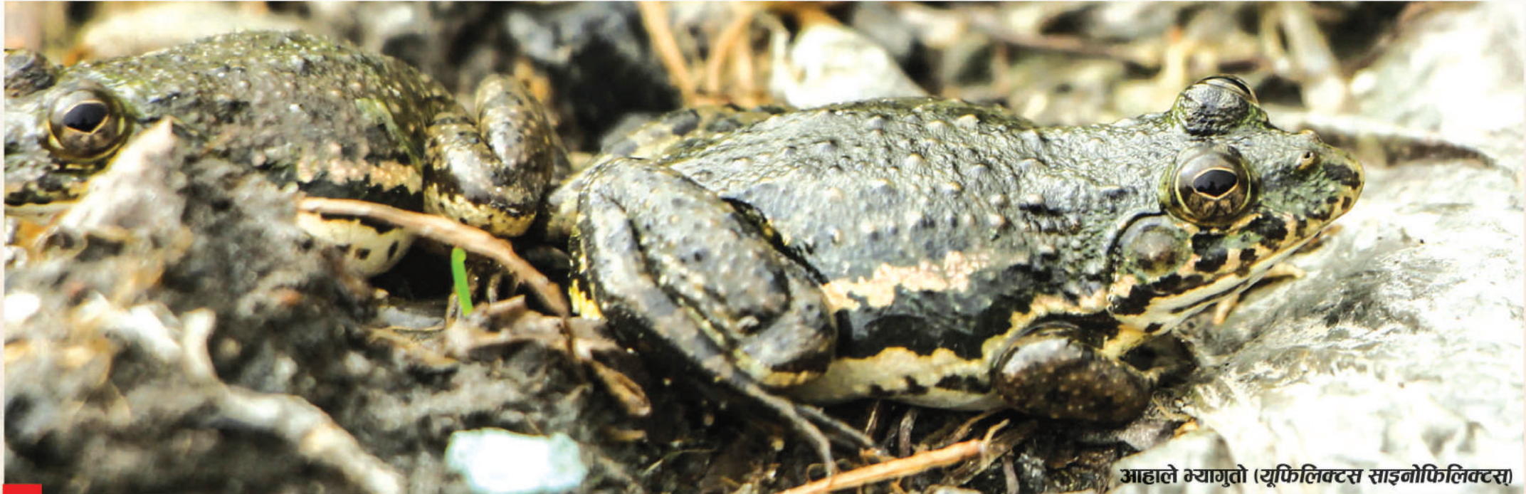
आहाले भ्यागुतो (यूफिलिक्टस साइनोफिलिक्टस)

Amphibians are cold-blooded creatures that have evolved in-between the two different class of animals; fish and reptile. They transformed from gill-breathing juvenile to lung-breathing adults. Amphibians possess moist skin without scales that aid in increasing the uptake of oxygen in water. Caecilians, newts, salamanders, frogs and toads are regarded as amphibians. They are divided into three orders: Gymnophiona, Caudata and Anura. All frogs and toads fall under Anura.