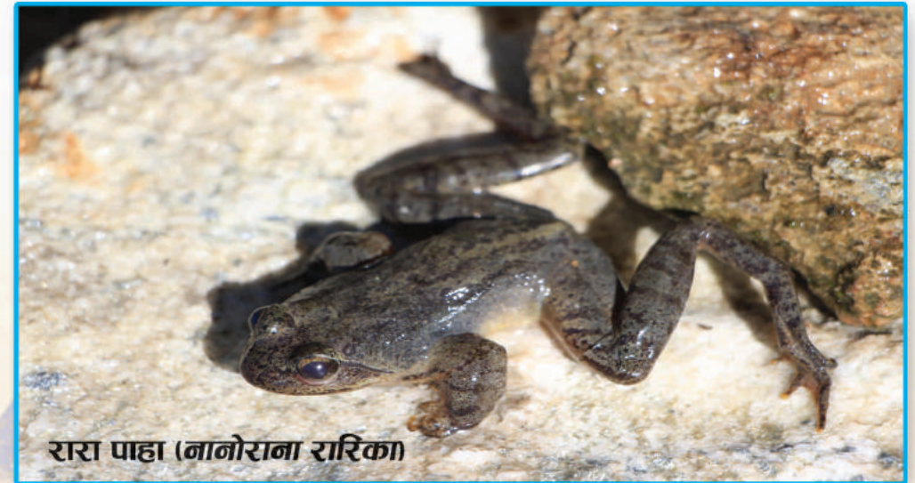
रारा पाहा (नानोराना रारिका)

Amphibians in Nepal are distributed across a wide altitudinal range from 100 m to above 5000 m (frogs from the genus Scutiger ). They inhabit a variety of habitats like forest, grassland, paddy field, lake, pond, marsh, river and stream.