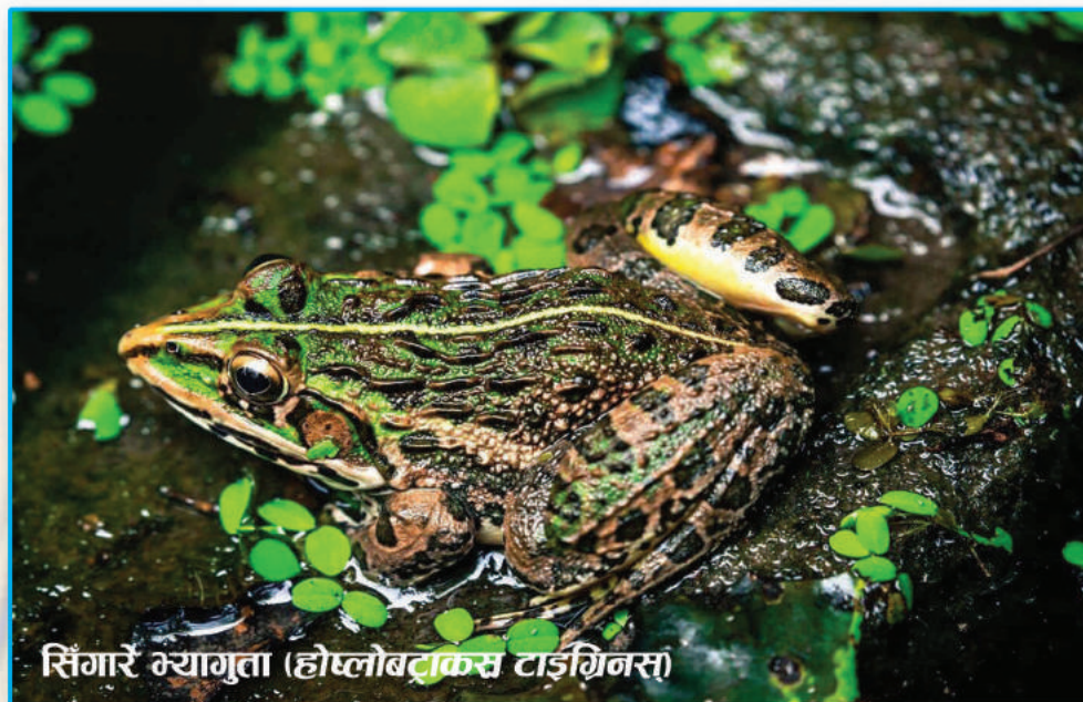
सिंगारें भ्यागुता (होप्लोबट्राफ्स टाइगिस)

Kathmandu Newars offer food to frogs in the month of Shrawan and even at Janai Purnima in a ritual called ‘Byan Janakewu’ (feeding the frogs). They also celebrate Gathemangal festival in exorcism of mythical demon Ghantakarna.